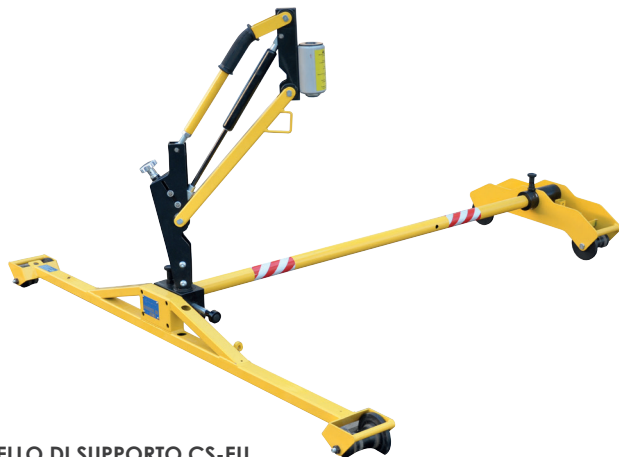
CARRELLO DI SUPPORTO CS-EU

Studiato per offrire il massimo supporto agli operatori, durante la foratura delle traverse e/o il serraggio o l'allentamento di elementi meccanici quali caviglie, chiavardini o chiavarde.