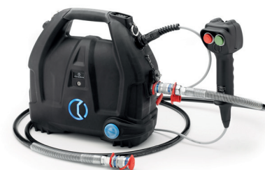
B70M-P36 Pompa elettro-oleodinamica portatile