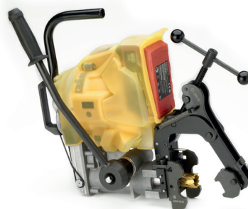
LD-16B-RP Taladro perforador de carril impermeable