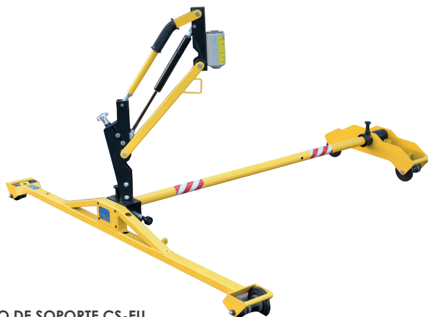
CARRO DE SOPORTE CS-EU

Estudiado para ofrecer el máximo soporte a los operarios durante la perforación de traviesas y/o el ajuste o aflojamiento de elementos mecánicos como tornillos o pernos.