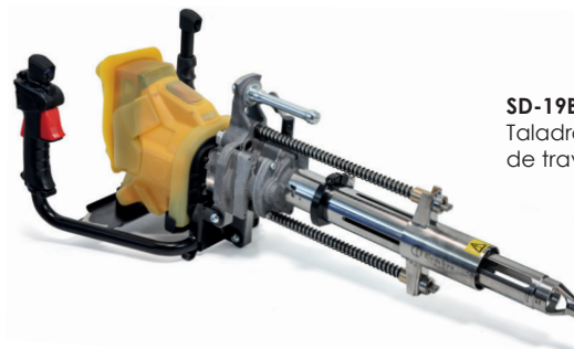
SD-19BR-RP Taladro perforador de traviesas impermeable